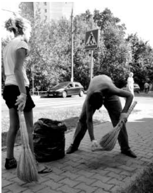
Уборка прихрамовой территории

12 июля , в день памяти первоверховных апостолов Петра и Павла, день своего Ангела отметил клирик храма свт. Иннокентия