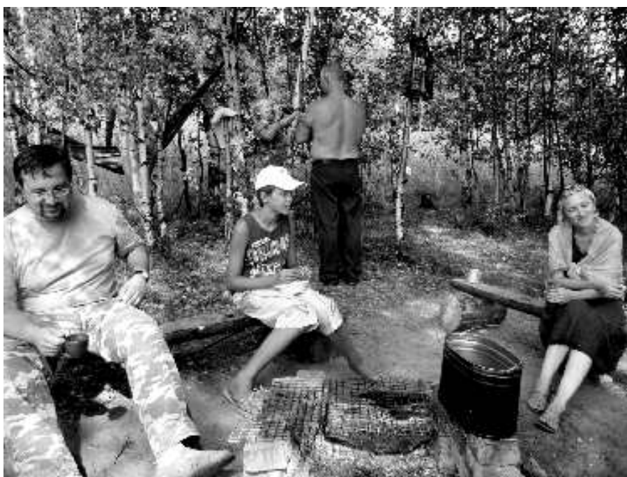
Обед в полевых условиях у костра

Сами раскопки интересны еще и тем, что это первое исследование территории монастыря, исчезнувшего в XVIII веке, и не застроенной позднее.