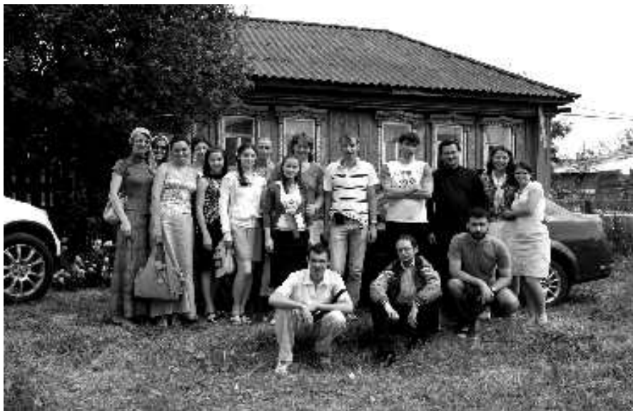
Группа православной молодежи «Ежечетверг»