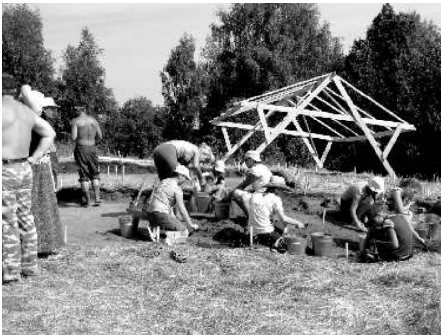
Подготовка площадки для дальнейших исследований

Позднее на вершине холма был основан Никольский монастырь. Дата его основания точно неизвестна. По легенде, в 1610 году во время польского нашествия монастырь был сожжен, а монахи замучены. К сожалению, по летописным свидетельствам, подобная судьба постигла все окрестные деревни и близлежащий Николо-Сольбинский монастырь, монахи которого также были убиты. На несколько десятилетий местность опустела, но затем монастырь на Тарховом холме был возобновлен и действовал вплоть до указа Екатерины II, закрывшей многие обители. Тогда монастырский храм был разобран, а брёвна отданы для печения просфор в храм святого