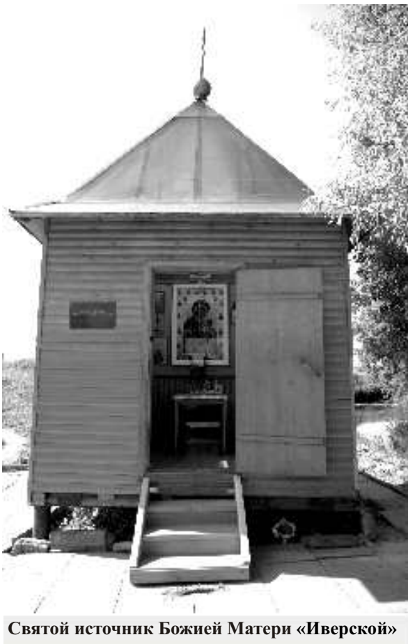
Святой источник Божией Матери «Иверской»