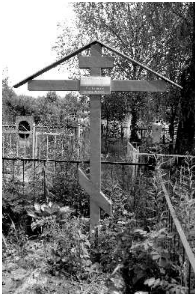
Могилка блаженной Анны